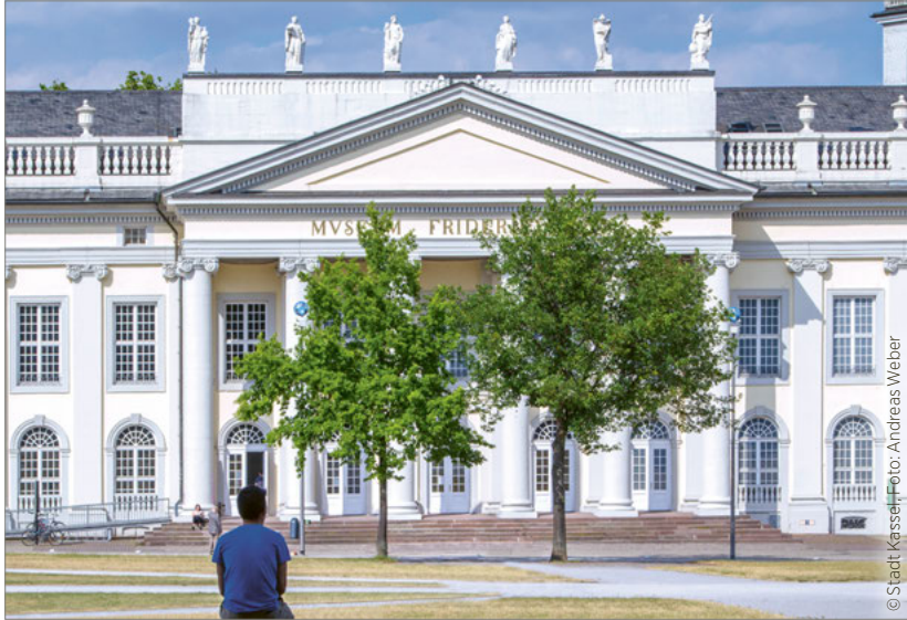
The first and the last of the trees planted for 7.000 Eichen [7,000 Oaks] in front of the Fridericianum in Kassel

of art extends far into other disciplines: ecology, politics and society are central fields of his work. The city of Kassel and the artist, who exhibited seven times at the documenta, are still closely connected today. A fluid grassroots democratic concept of art and principles and processes of participation in and beyond art are a living Beuysian legacy, not only during the documenta exhibitions.