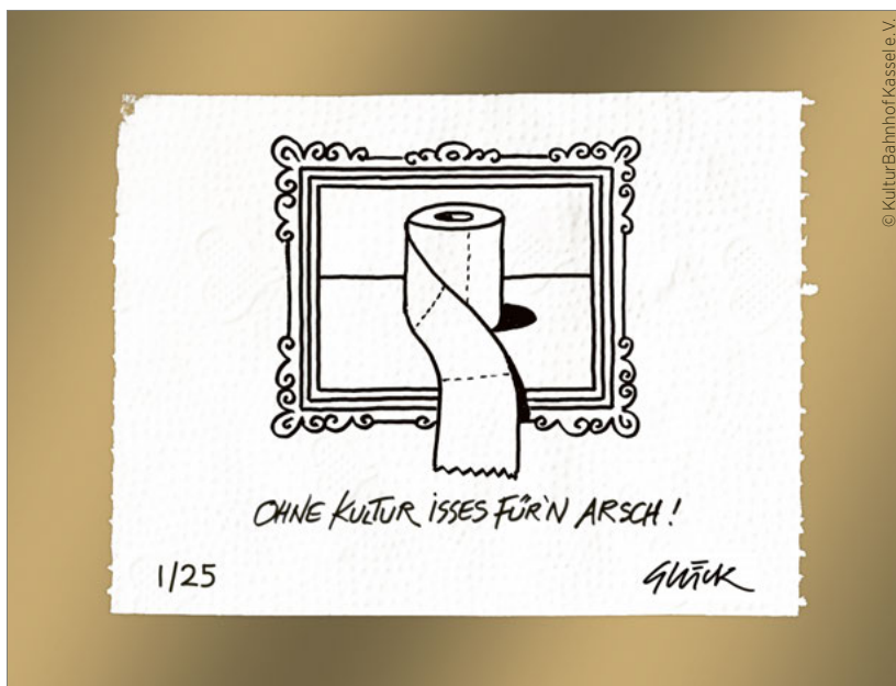
Limitierter Druck der Solidaritäts-Aktion Ohne Kultur isses für'n Arsch!

Klein- und Kleinunternehmen aufgelegt hat, darunter auch zahlreiche Kulturunternehmungen, sondern die Verwaltung, Institutionen und Szenen selbst haben gemeinsam nach Wegen gesucht und diese gefunden, Kultur während der Pandemie zu schützen und zu stützen. Tausende Stunden an Beratung durch die Kulturförderung und -beratung des Kulturamtes konnten so zielgerichtet eingesetzt werden. Institutionen und Netzwerke haben eigene Fundraising-Programme entwickelt, darunter die Initiative KulturBahnhof mit der Toilettenpapier-Aktion Ohne Kultur isses für'n Arsch! 35 und der Personalrat mit den Beschäftigten des Staatstheaters Kassel und weiteren unterstützenden Institutionen mit der Initiative Einkommen schaffen! 36 . Beide Aktionen zusammen haben über 150 000 Euro generiert und kamen insbesondere Soloselbstständigen der Freien Kulturszenen zugute. Die Kasseler Museumsnacht hat die Flucht nach vorn angetreten, und statt eines Wegfalls der beliebten, aber sehr dicht gedrängten Veranstaltung hat die Stadt Kassel gemeinsam mit den