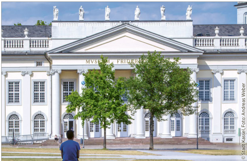
Der erste und der letzte Baum der 7.000 Eichen vor dem Fridericianum in Kassel

Das Kunstwerk 7000 Eichen war zudem als eine konsequente Soziale Plastik von Beginn an Gegenstand des gesellschaftlichen Diskurses in seiner ganzen ästhetischen, inhaltlichen wie auch emotionalen Bandbreite. Anfänglich herrschte nicht nur Skepsis, sondern das Werk machte Menschen wütend. Der Keil aus Basaltstelen auf dem Friedrichsplatz versetzte Bürgerinnen und Bürger in Rage, und sie protestierten lautstark dagegen. Bäume, die im Weg standen, wurden zudem zu Objekten der Ablehnung und der Beschädigung. Heute, gut 40 Jahre später, ist dies kaum noch, allenfalls selten vorstellbar, denn die Stadt und die Stadtgesellschaft identifizieren sich in besonderer Weise mit diesem einmaligen Kunstwerk.