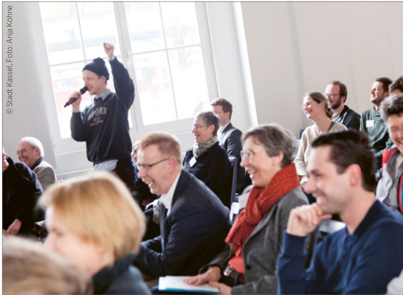
Partizipativer Prozess der Kulturkonzeption Kassel 2030

Kulturelle strategische Entwicklungsplanungen oder auch Kulturkonzeptionen sind dem Grunde nach ebenfalls bereits Nachhaltigkeitsstrategien. Kulturelle Langzeitstrategien tragen mit ihren Zielen, Leitlinien und Maßnahmenvorschlägen konsistent zur verantwortlichen und verantwortungsvollen kulturellen Weiterentwicklung bei. Insbesondere wenn diese nicht als Einzelleistung entwickelt werden, sondern aus partizipativen Prozessen mit den handelnden Kulturinstitutionen und -initiativen, Politik und Verwaltung gemeinsam entstehen, kann die kollektive Kraft schließlich in die Umsetzung investiert werden und verliert sich nicht in Parallelprozessen oder gar langfristigen grundsätzlichen Richtungsdebatten.