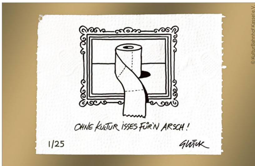
Limited printing of the Solidarity Action Ohne Kultur isses für'n Arsch! [It's shitty without culture!]

The COVID-19 pandemic fell in the middle of this implementation period. This cannot go unmentioned, because Kassel not only launched a special programme to the tune of 18 million euro to support small and micro-enterprises, including numerous cultural enterprises, but the administration, institutions and protagonists themselves worked together to find ways to protect and support culture during the pandemic, too. Thousands of hours of advice from the Cultural Promotion and Advisory Service of the Cultural Office was thus put to use in a targeted way. Institutions and networks developed their own fundraising programmes, including the KulturBahnhof initiative's toilet paper campaign Ohne Kultur isses für'n Arsch! [It's shitty without culture!] 35 and the initiative of the staff council with the employees of the Staatstheater Kassel [State Theatre Kassel] and other supporting institutions Einkommen schaffen! 36 The campaigns together generated over 150,000 euro and benefited in particular solo independents working in the various cultural sectors. The Museumsnacht [Night of Museums] in Kassel took the flight forward and