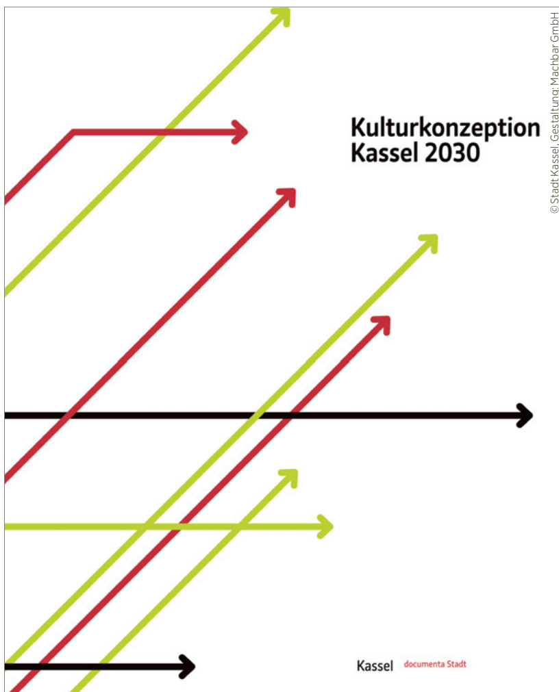
Titelblatt der Kulturkonzeption Kassel 2030

Die Publikation beginnt mit einem Kapitel zu strukturellen Nachhaltigkeitsstrategien, die in übergeordneten kulturellen Kontexten Kräfte bündeln und nachhaltige Entwicklungen stärken. Den generellen Rahmen definieren hierfür die 17 Ziele für nachhaltige Entwicklung [Sustainable