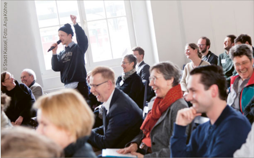
Participatory process of the Kulturkonzeption Kassel 2030 [Culture Concept Kassel 2030]

During the process, however, it was decided that the application would not be pursued instead the corresponding resources would be invested in the long-term and sustainable development of Kassel's culture. As in many other cities, the process was accompanied by the Institut für Kulturpolitik of the Kulturpolitische Gesellschaft e. V. 29 At the end of 2018, the jointly developed Culture Concept Kassel 2030 was adopted by the city council by a broad majority and has been in place since then. The status of implementation is reported on continuously and transparently. The concept shows perspectives and measures for the further development of institutions, initiatives and workers, framework conditions and factors that distinguish Kassel as a cultural location, as well as problems that need to be solved. These problems include the lack of space, especially for independent artists and other creatives, as well as the need for extension of funding eligibility to keep up with changing times, for example, to include the funding priorities of cultural education, invigorating neighbourhoods, and participation, visibility and cooperation. The need for new institutions, such as a centre for creative industries or a house for literature, and support for the work of